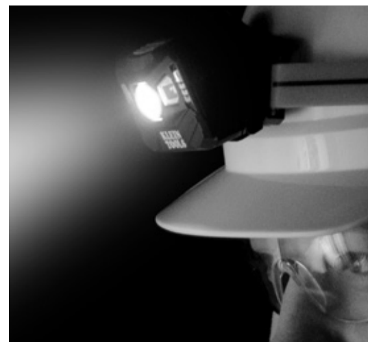
FIG. A FRONT / FRENTE / AVANT