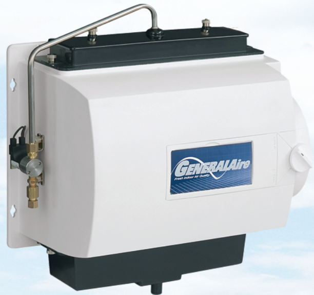
Not all models shown. Model 1042 pictured above.